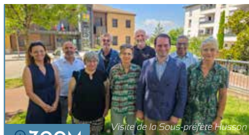
Visite de la Sous-préfète Husson

Magazine de la commune de La Tour de Salvagny