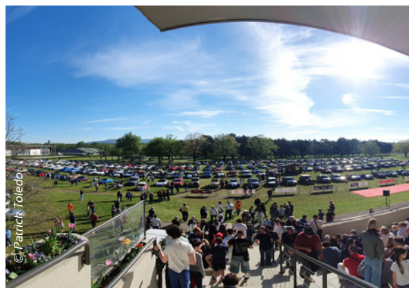
La Traversée de Lyon