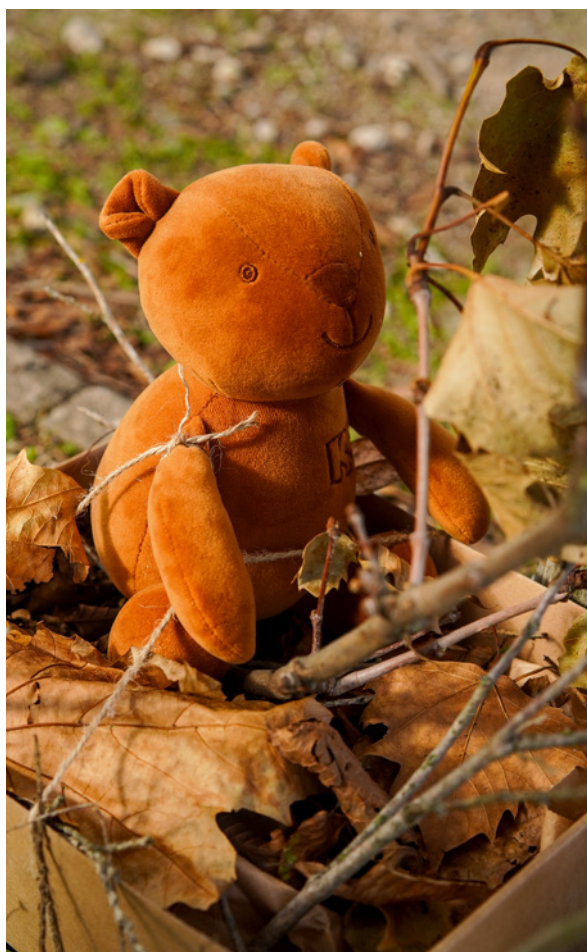
Les Natures d'Automne

Qu'elles soient à vocation culturelle, sportive ou de loisirs, les associations tourelloises insufflent un véritable dynamisme et sont la force vive qui anime la commune et renforce le lien social. Des centaines de bénévoles passionnés œuvrent chaque jour pour proposer des activités culturelles, sportives, solidaires ou citoyennes. Elles savent pouvoir compter sur le soutien des élus et l'aide des services municipaux pour faire vivre des projets variés qui touchent toutes les générations.