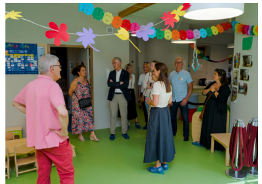
Relais petite enfance