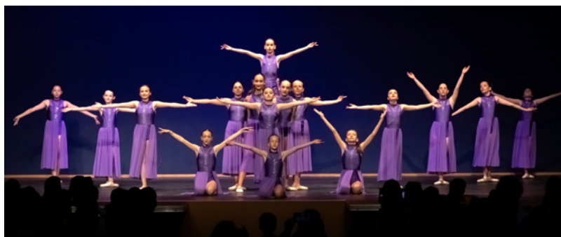
Le gala de danse de l'AAEP