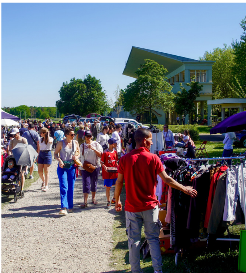
Le vide grenier du 1 er mai