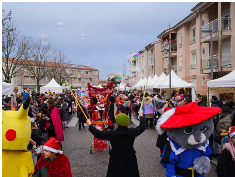
Le marché de Noël chaque premier week-end de décembre