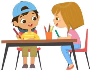
Echanger, discuter avec les autres