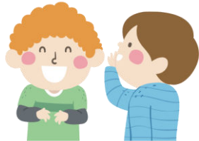
Parler sans crier