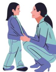
Signaler un problème