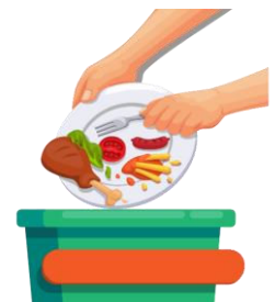
Gaspiller la nourriture