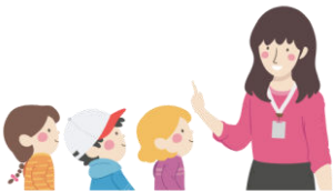
Être attentif aux consignes