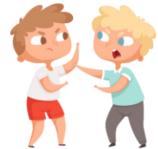
Courir et se battre