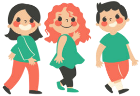
Entrer et sortir dans le calme