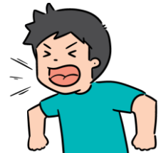
Crier, casser le matériel