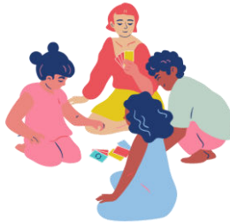
Jouer, rire, s'amuser