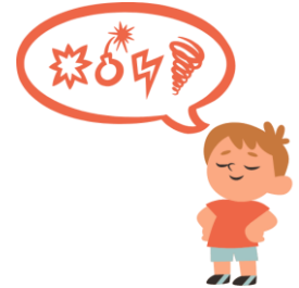
Être incorrect avec les autres