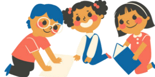
Passer du temps avec les copains