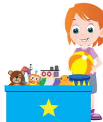
Respecter, nettoyer le matériel