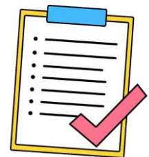
Désobéir aux consignes