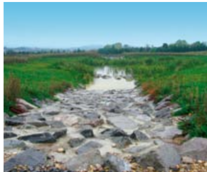
Trois bassins de rétention des eaux de pluie, reliés les uns aux autres, sont aménagés.

Trois bassins de rétention ont été réalisés sur chaque strate du site. Reliés entre eux, ils constituent des zones de stockage provisoire en cas d'averse, mais aussi des points de chute pour les eaux de ruissellement qui transiteront par les noues présentes le long des voiries. Une partie de ces eaux permettra d'irriguer les plantations, tandis que l'autre sera progressivement rendue à la rivière. Le procédé répond par ailleurs à une exigence environnementale, puisque que les bassins permettront d'éviter l'imperméabilisation des sols induite par les constructions et susceptible d'aggraver les phénomènes de crues. C'est sans oublier que les bassins de rétention contribuent à valoriser l'aménagement paysager du site, en soulignant le caractère humide du vallon et en renforçant le caractère naturel du site.